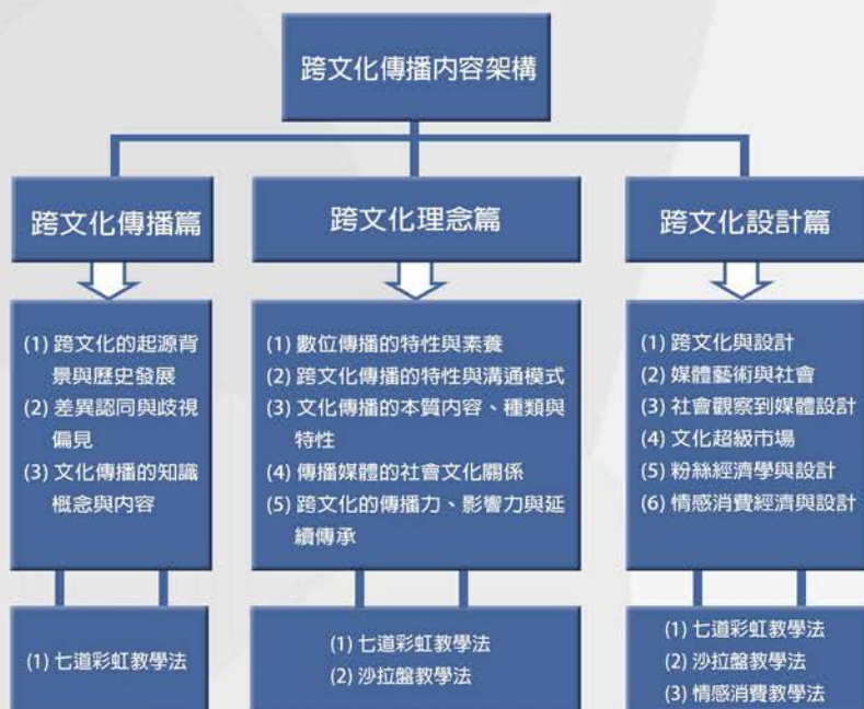
創新課程教學的內容架構